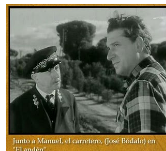
Junto a Manuel, el carretero, (José Bódalo) en "El andén"